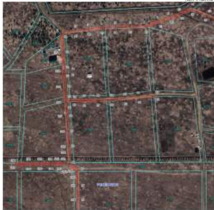
Лист 1. Листов 5