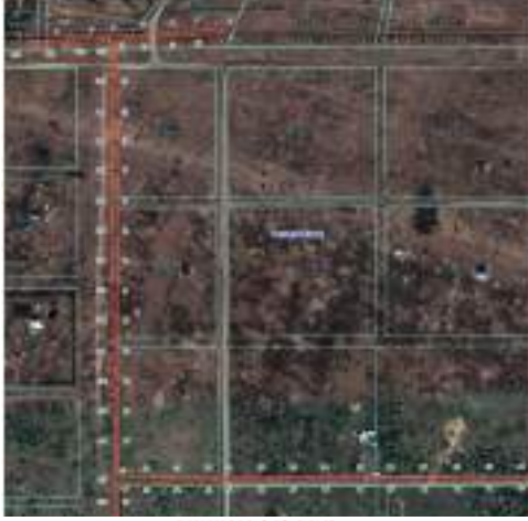
Используемые условные знаки и обозначения: — Границы публичного сервитута — 74:09:0912001 Границы и кадастровый номер кадастрового квартала — 1:100 Границы и обозначение земельного участка, сведения о котором внесены в ЕГРН