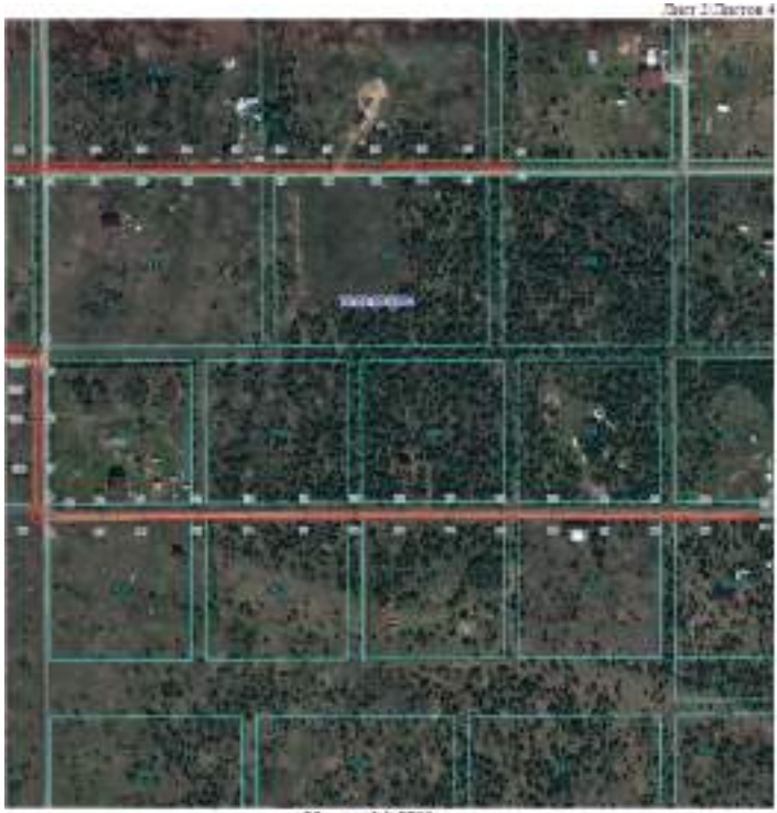
Используемые условные знаки и обозначения: — Границы публичного сервитута — 74:09:0912001 Границы и кадастровый номер кадастрового квартала — 1:100 Границы и обозначение земельного участка, сведения о котором внесены в ЕГРН