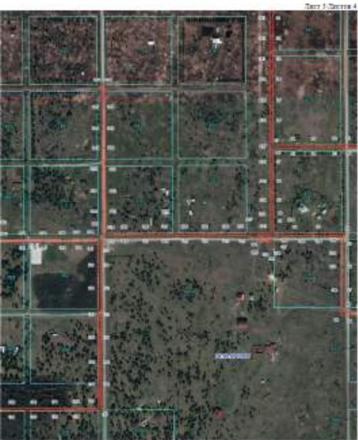
Используемые условные знаки и обозначения: — Границы публичного сервитута — 74:09:0912001 Границы и кадастровый номер кадастрового квартала — 1:100 Границы и обозначение земельного участка, сведения о котором внесены в ЕГРН